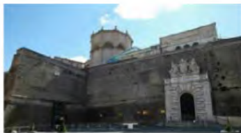
Menschenleerer Eingangsbereich zu den Museen

Italiens Regierung hatte kürzlich die Corona-Einschränkungen für das