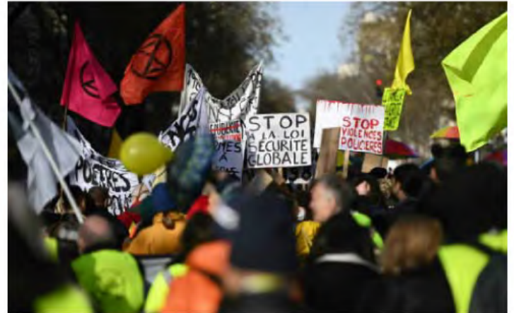
Proteste gegen Polizeigewalt

„Ich bin heute aus zwei Gründen gekommen - wegen des umfassenden Sicherheitsgesetzes und auch, um die Kultur zu unterstützen“, sagte die 24-jährige Demonstrantin Kim. „Viele Geschäfte sind geöffnet, die U-Bahn ist voll, aber die Kulturstätten sind geschlossen“,