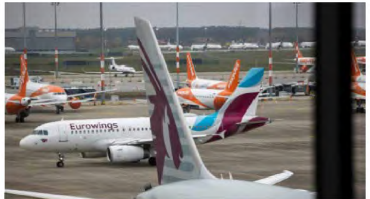
Flugzeuge am BER

Fluggesellschaften, Busunternehmen oder die Bahn sind laut der Verordnung verpflichtet, „Beförderungen aus diesen Gebieten in die Bundesrepublik Deutschland zu unterlassen“. Ausnahmen gibt es demnach etwa für Menschen, die