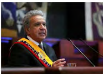
Ecuadors Präsident Lenin Moreno

Quito (AFP) - Das Flugzeug des ecuadorianischen Präsidenten Lenin Moreno hat kurz nach dem