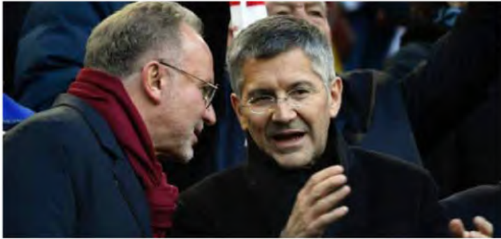
Bayern-Präsident Herbert Hainer steht zu Trainer Flick