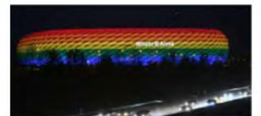
Für Vielfalt setzt sich die DFL ein

Der Erinnerungstag wurde 2004 durch die Initiative „Nie wieder“ ins Leben gerufen, die sich die Botschaft der Überlebenden des ehemaligen Konzentrationslagers Dachau zu eigen gemacht hat. „Das gemeinsame Ziel des ‚Erinnerungstages im deutschen Fußball‘ ist es, einen Beitrag zu einer lebendigen Erinnerungskultur zu leisten und sich für ein respektvolles, wertschätzendes