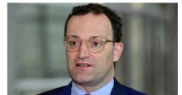
Gesundheitsminister Jens Spahn

Zu den Lieferungen der Impfstoffe sagte er, bis zum 22. Februar hätten die Firmen die Lieferung von insgesamt fünf Millionen Dosen mit Lieferdaten angekündigt. Bislang seien 3,5 Millionen Dosen ausgeliefert worden, mehr als zwei Millionen davon seien bereits verimpft worden.